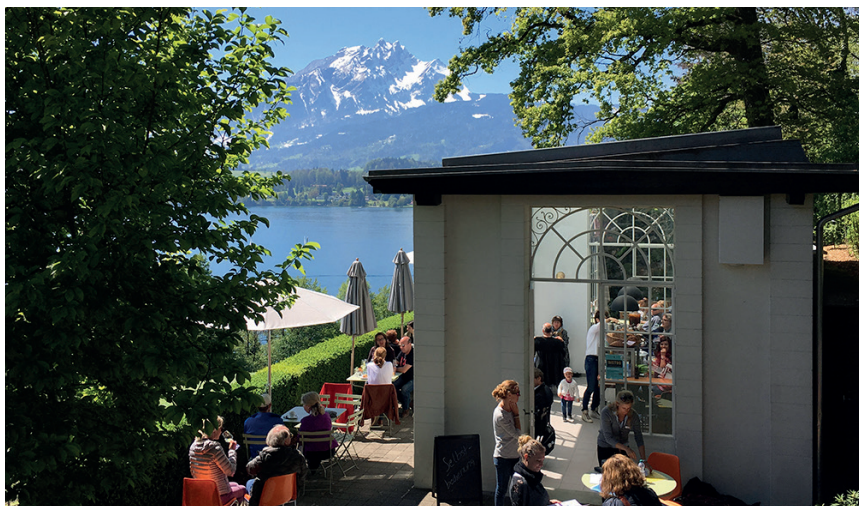
Herrlich gelegen: Das Schlossbistro Meggenhorn mit phantastischem Blick auf den See und zum Pilatus.

Willkommen zur voraussichtlich letzten Megger Gemeindeversammlung. Behandelt werden der Jahresbericht und die Jahresrechnung 2022 der Gemeinde Meggen sowie die Bauabrechnung Erneuerung Transportwasserleitung Lauerz-Meggen, Etappe A. Der Gemeinderat orientiert über die Teilrevision der Gemeindeordnung (Urnenabstimmung vom 18. Juni 2023). Unter Verschiedenes können Wünsche und Anregungen angebracht werden.