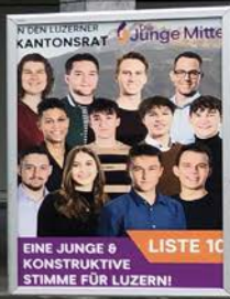
Wahlplakate für die Kantonsratswahlen auf dem Dorfplatz.