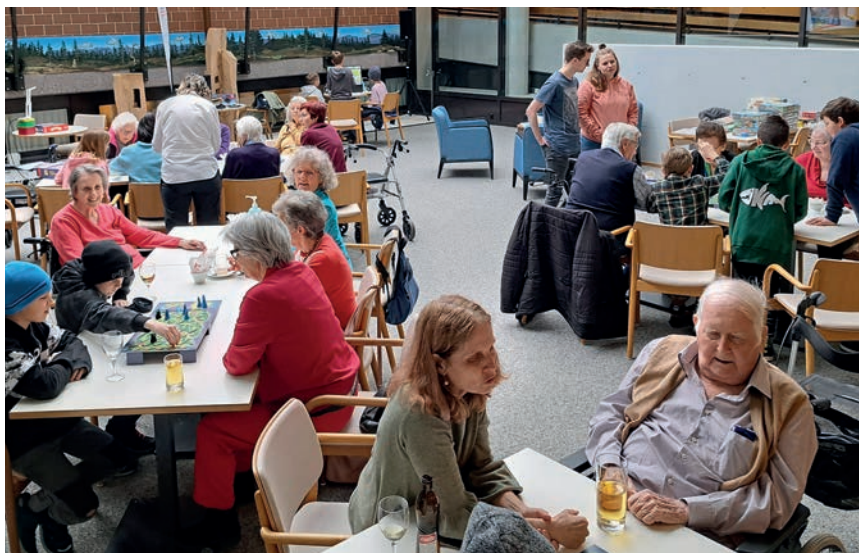
Die Generationen begegneten sich beim GAMERS POINT im Sunneziel Meggen.

Organisiert wurde der Event erneut vom GAMERS POINT (kirchliche Jugendarbeit meggerwald pfarreien) in Zusammenarbeit mit der Kinder- und Jugendarbeit Gemeinde Meggen und dem Sunneziel. Mit an Bord waren auch der Verein Senioren Meggen und der Schweizerische Frauenverein Meggen. Die Jungwacht nutzte die Chance und nahm zahlreich am öffentlichen Anlass teil.