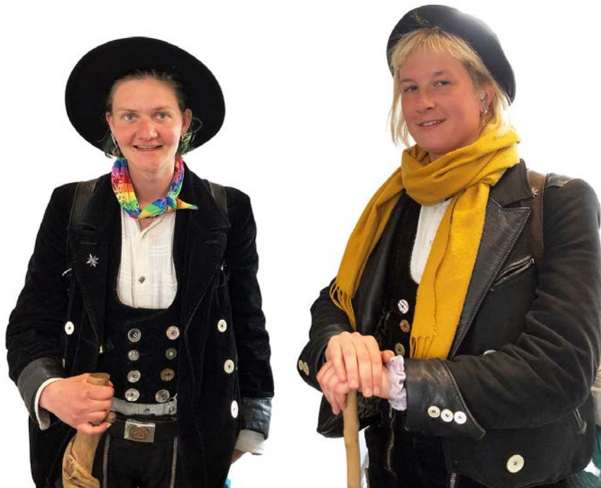
Die beiden Zimmerinnen aus Deutschland am Schalter der Einwohnerkontrolle im Gemeindehaus.

Die Wandergesellen müssen zwischen 20 und 30 Jahre alt sein, ungebunden, kinderlos und schuldenfrei sein. Zwei weibliche Vertreterinnen der Handwerkszunft, zwei Zimmerinnen aus Deutschland, statteten Mitte März 2023 der Gemeindeverwaltung einen sympathischen Besuch ab.