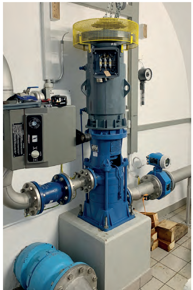
Installation der Pumpe im Reservoir.