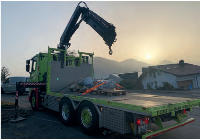
Transport der revidierten, rund 800 kg schweren Pumpe mit einem Lastwagen zum Reservoir.