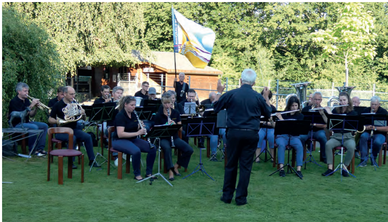
Der Musikverein beim einzigen Auftritt im Jahr 2020 (Sunneziel-Park).