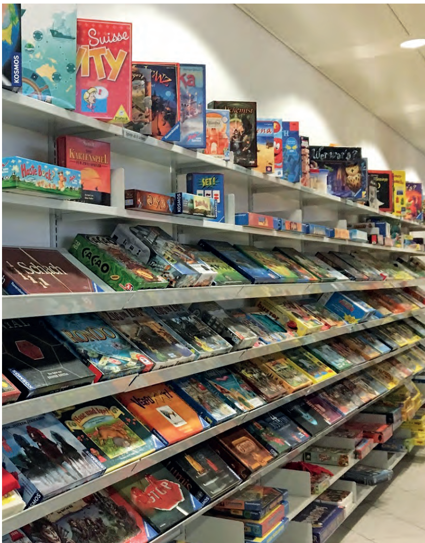
Grosse Auswahl: Spielewand in der Ludothek, im EG Gemeindehaus.

https://www.sgfmeppen.ch/unsere-institutionen/ludothek