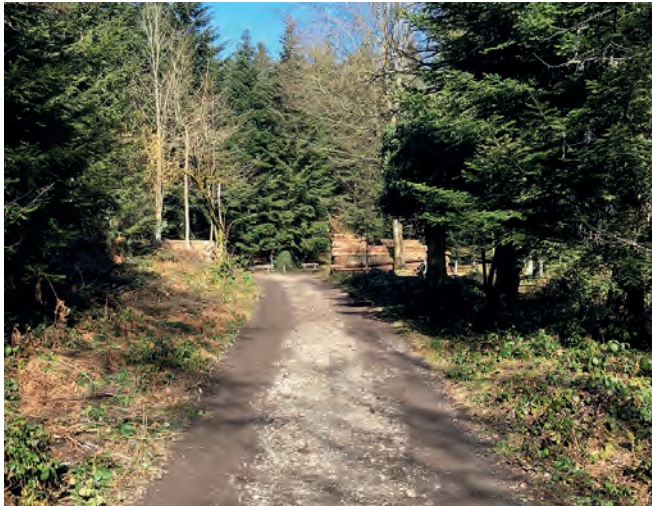
Es gibt viele schöne Wanderwege im Meggerwald.