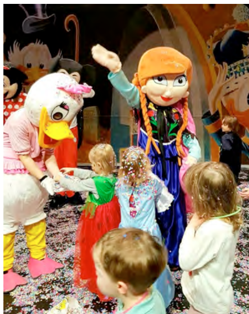
Kinderball der Fröschenzunft.