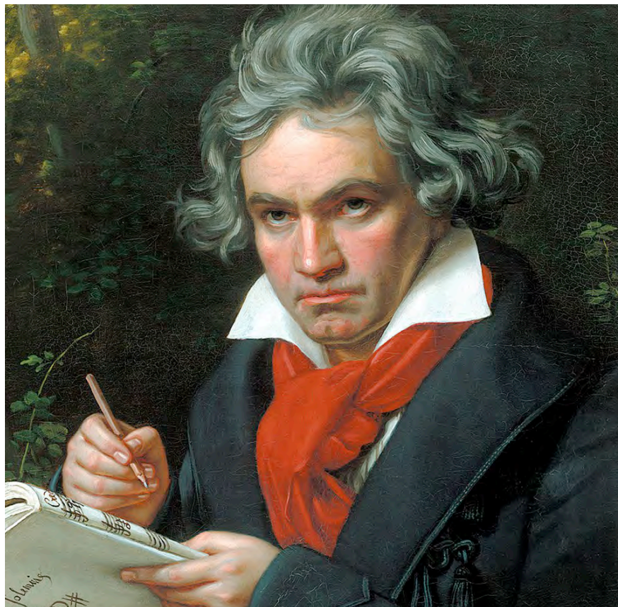
Ludwig van Beethoven (1770–1827); idealisierendes Gemälde von Joseph Karl Stieler, ca. 1820.

Ab sofort können Sie Abonnemente für diese Konzertreihe unter Telefon 041 250 79 02 oder im Web unter www.klang.ch be-