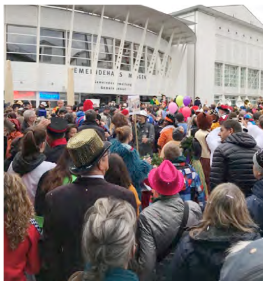
Fasnachtssonntag: Grossaufmarsch der Fasnächtlerinnen und Fasnächtler nach dem Umzug auf dem Dorfplatz.