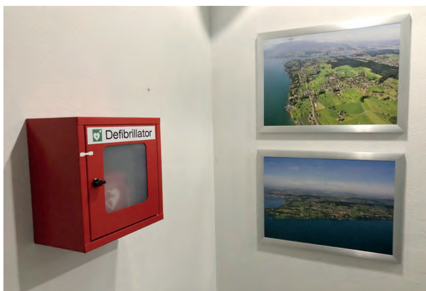
... sowie im EG des Gemeindehauses.