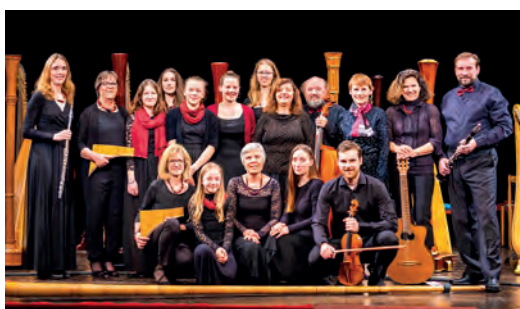
Das Harfenorchester Arpa Doro.