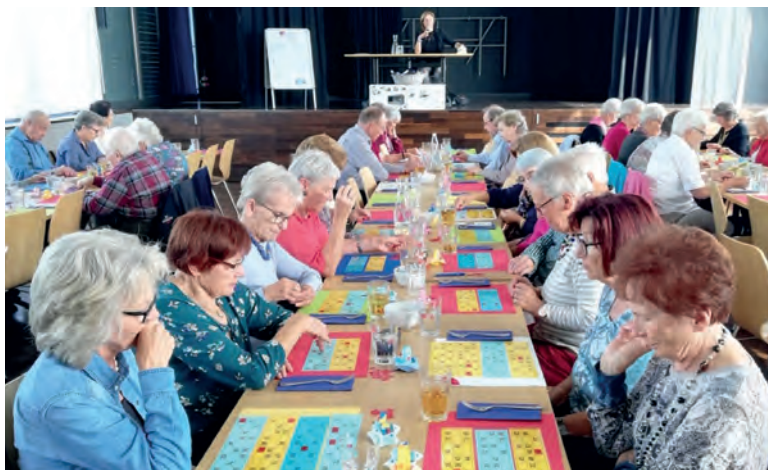
Grosse Spannung im Saal: Welche Zahl wird wohl als Nächstes gezogen?