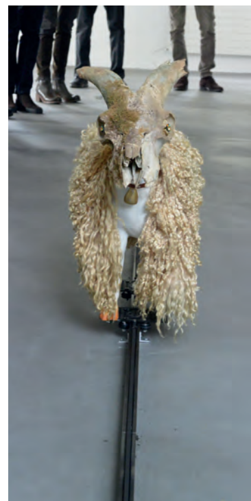
Das motorisierte Schaf bewegte sich von einer Seite auf die andere.