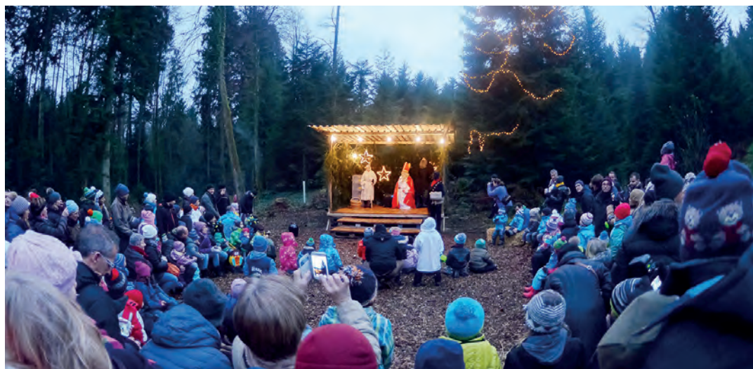
Immer wieder eindrücklich: Der Besuch des Samichlaus im Meggerwald.