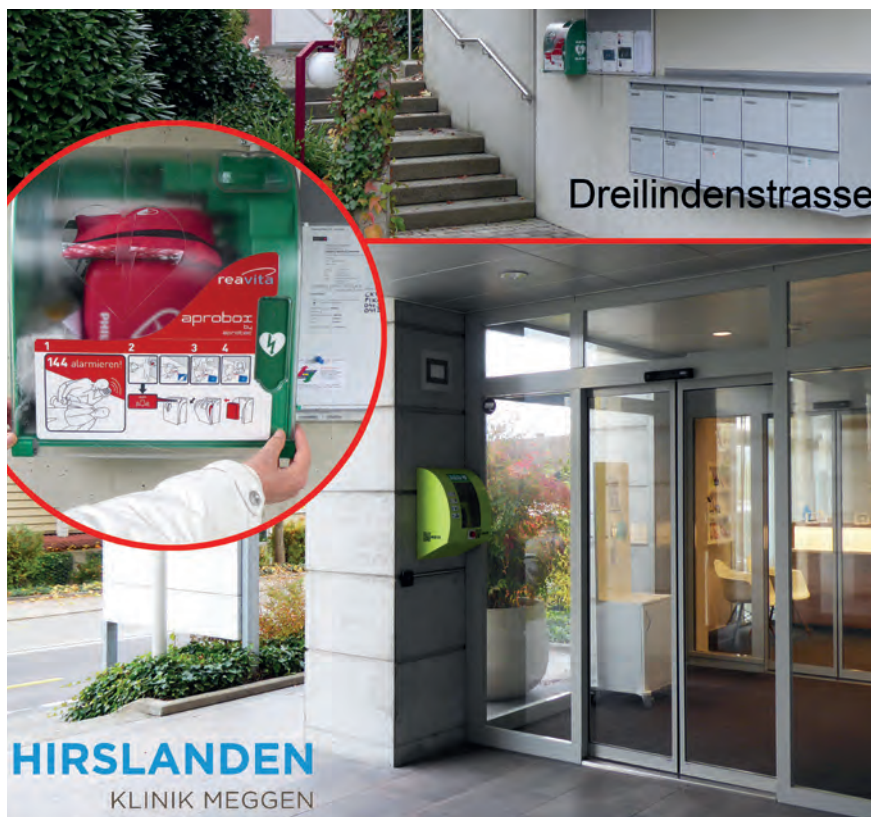
Die drei jederzeit öffentlich zugänglichen Defis befinden sich oben an der Dreilindenstrasse und bei der Hirslanden Klinik Meggen ...

Der dritte jederzeit öffentlich zugängliche Defi befindet sich beim Haustelefon im EG des Gemeindehauses.