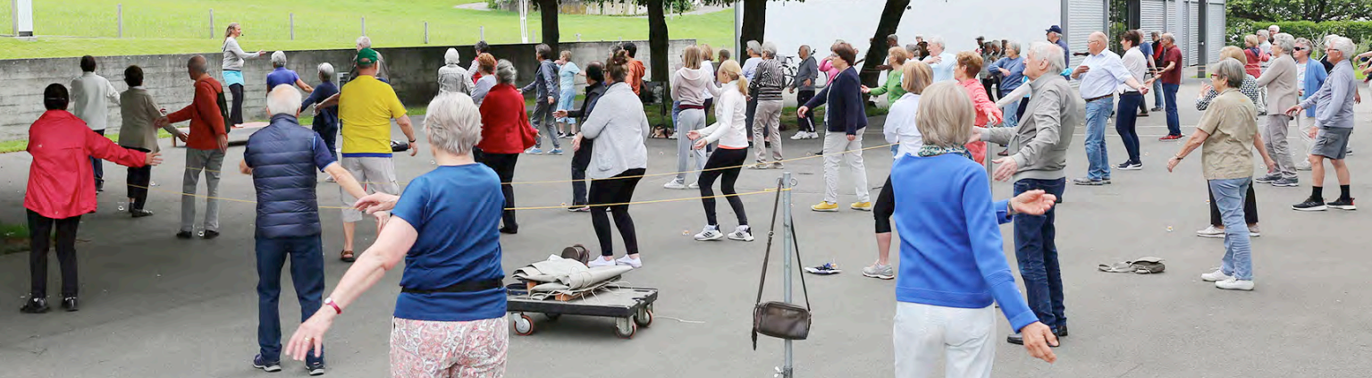
Qigong in Meggen