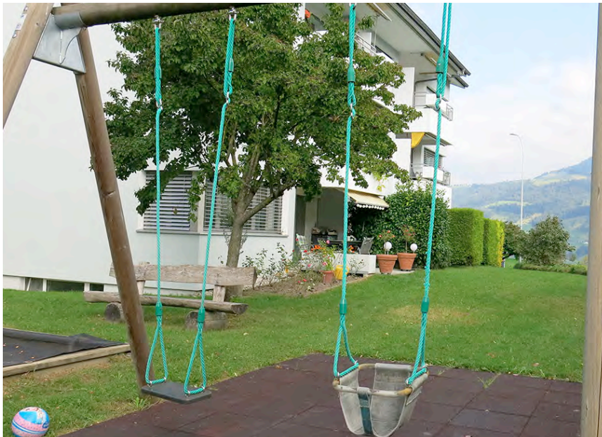
Das Wohnhaus an der Sentibühlstrasse wurde im Jahr 1974 gebaut.

In den 1970er-Jahren bestand im aufstrebenden Meggen ein grosser Bedarf an preisgünstigen Wohnungen. Deshalb gründeten am 19. April 1971 neun Meggerinnen und Megger aus dem Umfeld der CVP die Wohnbaugenossenschaft Meggen. Ziel war die Realisierung von finanzierbaren Wohnungen insbesondere für Megger Familien.