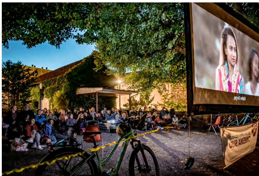
Cinema Sud ist am 3. und 4. Juli 2021 zu Gast auf Meggenhorn.

Der Film «The True Cost» lüftet den Schleier und befragt Menschen, die sich in der Modeindus-