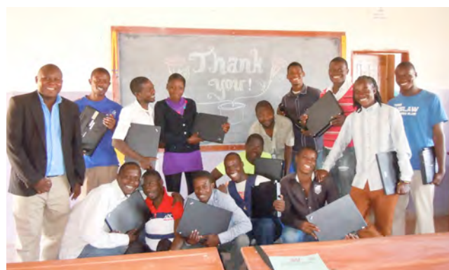
Übergabe von fünf Laptops der Schule Meggen im Jahr 2015 an die Berufsschule in Sambia.

sehr froh über das erneute Geschenk. Die Auszubildenden haben dank Ihrer Spende die Möglichkeit, sich neben der Fachausbildung auch ein Computer-Basiswissen anzueignen. Das ist bei ihren Bewerbungen ein Plus.» Weitere Informationen erhalten Sie unter www.berufsbildung-sambia.ch .