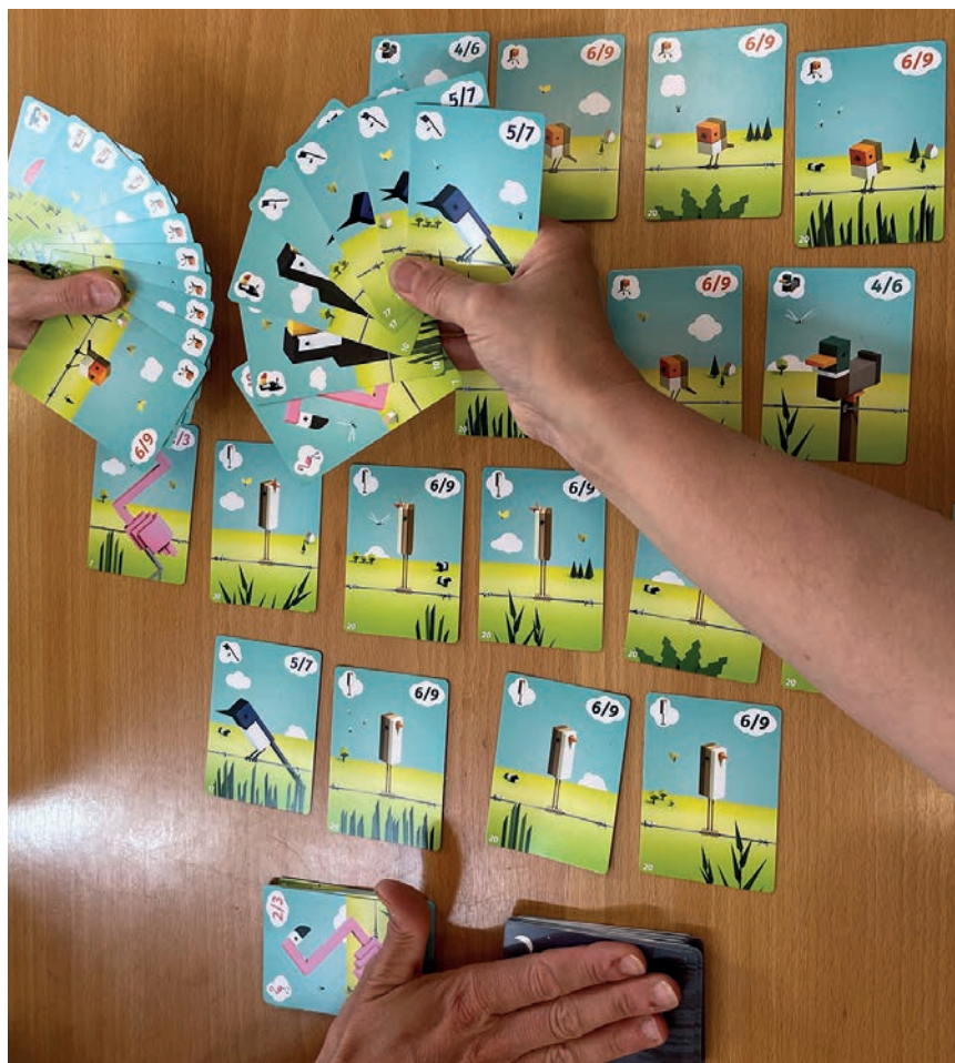
Vogelarten sammeln mit dem Kartenspiel «CuBirds».

Weit vorn liegt das Kartenlege-spiel «CuBirds» für bis zu fünf Teilnehmer ab acht Jahren, die etwa 20 Minuten für eine Partie benötigen. Gesammelt werden acht verschiedene Vogelarten, die einen Schwarm bilden müssen. Nicht leicht, da alle Spieler an die gleichen Karten wollen! Ebenfalls ein empfehlenswertes Reise-Kartenspiel ist «Fröschis» für Vorschulkinder, das sogar fast «Kinderspiel des Jahres» geworden wäre. Hier lernt man fast nebenbei noch die Zahlen. Jetzt ausleihbar!