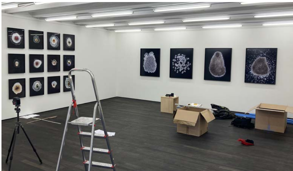
Einrichten der Ausstellung im Benzeholz Raum für zeitgenössische Kunst Meggen.