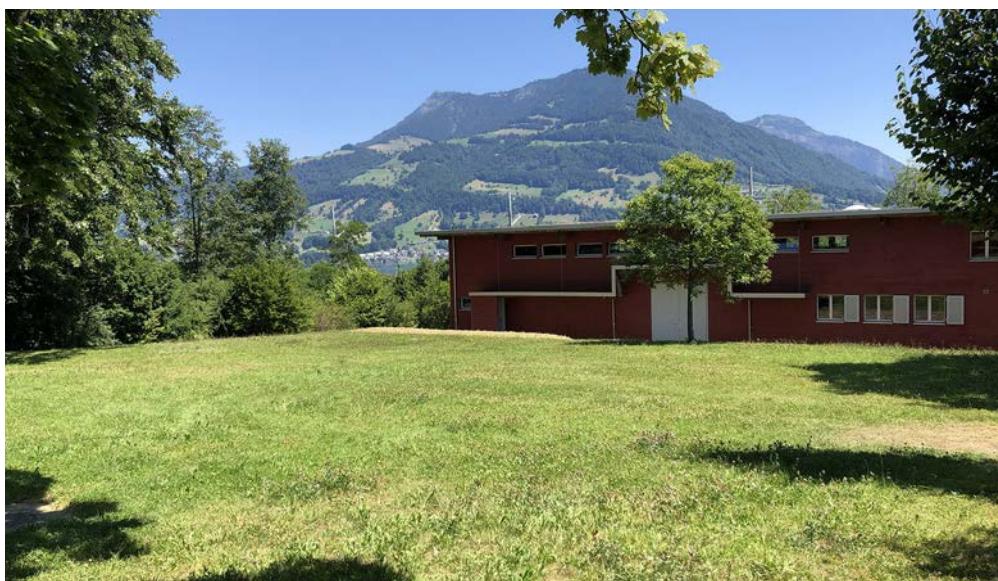
Der vorgesehene Standort für die Erstellung der Container-Anlage im Gebiet Gottlieben, vis-à-vis der Magdalenenkirche unterhalb der Parkplätze.