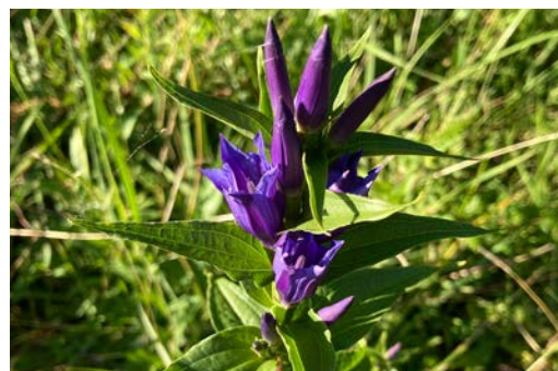
Blühender Schwalbenwurz-Enzian im Schutzgebiet Schlittenried im Meggerwald.

Der Schwalbenwurz-Enzian ist eine typische Pflanze, die man jetzt in Riedwiesen des Meggerwalds findet. Im Gegensatz zum bekannten klassischen Glocken-Enzian, der im Frühling in den Alpen blüht, erfreut der Schwalbenwurz-Enzian im Sommer mit seinen typischen, enzianblauen Blüten Mensch und Natur.