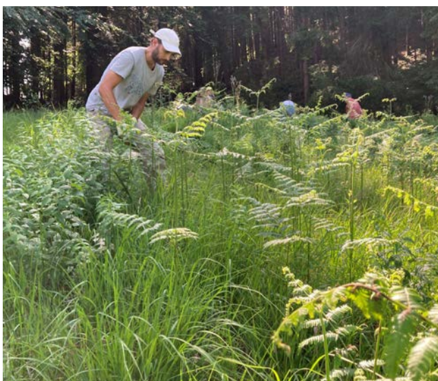
Der Einsatz von Freiwilligen schafft Platz für seltene Pflanzen und Tierarten im Meggerwald.

Der Meggerwald mit seinen Schutzgebieten ist ein Natur-Highlight direkt vor unserer Haustür. Ein Schutzgebiet reiht sich ans andere und viele davon geniessen gar nationalen Schutz, weil dort seltene Tier- und Pflanzenarten Lebensraum finden. Dass dies so bleibt, ist auch dem Einsatz von Freiwilligen zu verdanken. In Handarbeit werden Adlerfarne gezupft, wo diese überhandnehmen und Schilfbestände reduziert, damit Biodiversität Platz hat. Nach mehreren Jahren Freiwilligenarbeit wird deren Wirkung spürbar, wie es sich beispielsweise an der Zunahme des Schwalbenwurz-Enzians oder Orchideen feststellen lässt. Der Einsatz wird entsprechend belohnt, auch wenn der Erfolg erst mit den Jahren sichtbar wird.