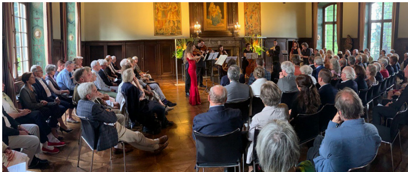
Eröffnungskonzert mit dem Schubert Oktett vom 24. Juni 2022.