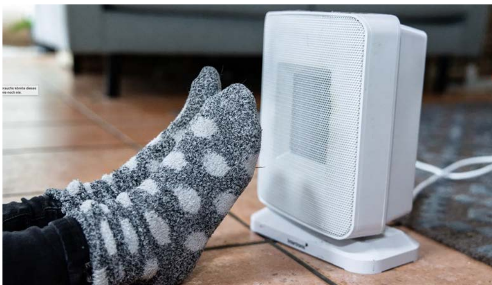
Ein Zehntel des Winter-Energieverbrauchs könnte in diesem Jahr fehlen. Deshalb ist das Thema Energiesparten so wichtig wie noch nie. Foto: 20min

Ständig geöffnete Kippfenster verpuffen vor allem im Winter viel Energie. Eine gute Luftqualität erreicht man auch, wenn man die Fenster dreimal täglich für fünf bis zehn Minuten öffnet.