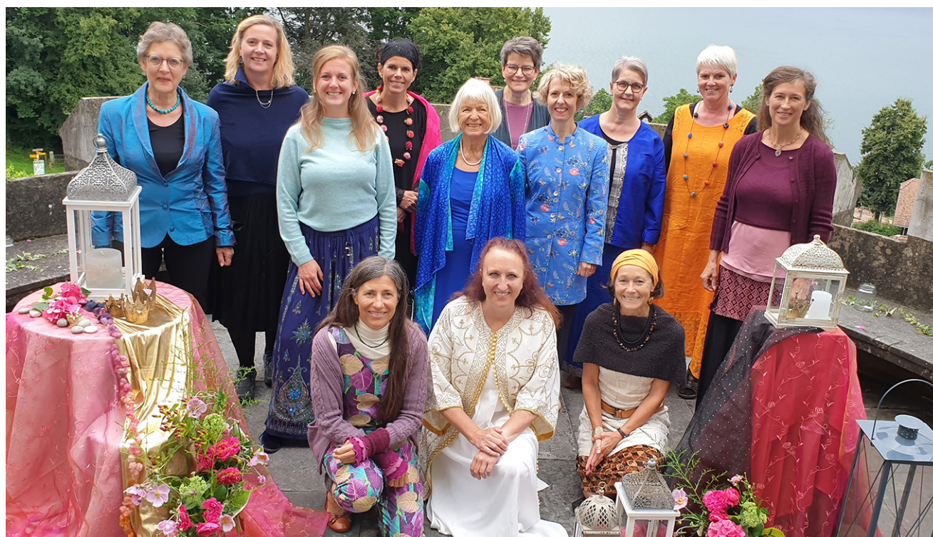
Die Abendspinnerinnen freuen sich auf Ihre Teilnahme an einem Schlossrundgang mit Märchen in Meggen.

Reservation und Ticketverkauf www.abendspinnereien.ch