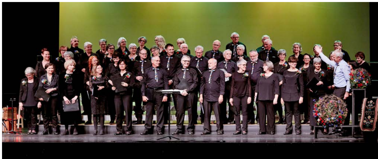
Der Cantus Meggen bei einem erfolgreiche Auftritt vor einem grossen, begeisterten Publikum.