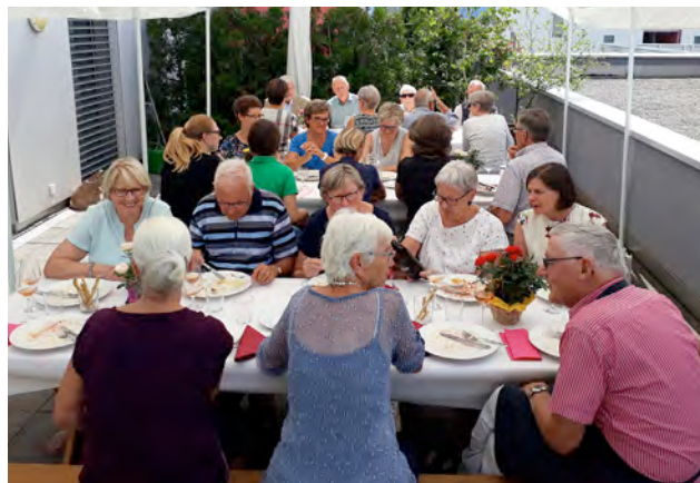
Das Jubiläum wird gefeiert.